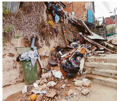
ESCALERA DE LA ZONA QUEDÓ INTERRUMPIDA POR ESCOMBROS.

“Desde el municipio nos reconocieron que, al tratarse de un terreno privado, no pueden llegar y entrar, pero sí habría disposición, a través de una cuadrilla, a limpiar el lugar, por lo que hay disposi-