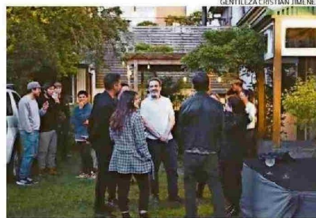
LABORATORIO ES OTRO DE LOS PROGRAMAS DE LA PLATAFORMA LOCAL.

Nos propusimos desde un comienzo poder contribuir al impulso del ecosistema creativo regional, partiendo por el sector audiovisual, pero con el deseo de ampliarnos hacia otras áreas y con una vocación regional, pero también internacional”.