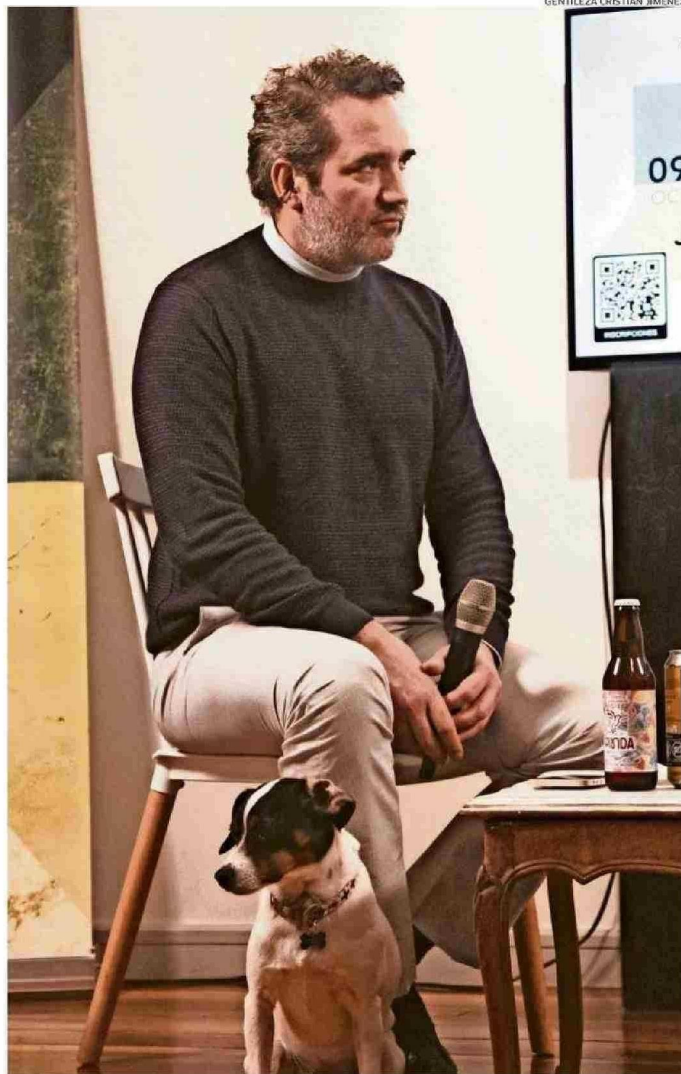
ALGA ESTUDIO FUNCIONA DESDE ENERO DE 2023 Y E CENTRO DE OPERACIONES ES CALLE ANWANDTER N°298.

- Nos propusimos desde un comienzo poder contribuir al impulso del ecosistema creativo regional, partiendo por el sector audiovisual, pero con el deseo de ampliarnos hacia otras áreas y con una vocación regio-