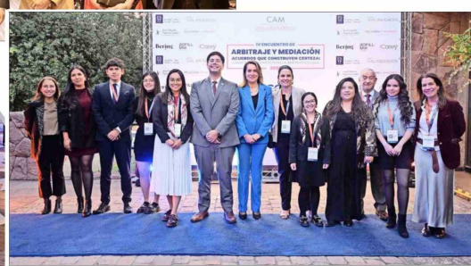
Equipo del CAM Santiago.