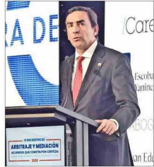
Ministro de Justicia y Derechos Humanos, Fernando Rabat.