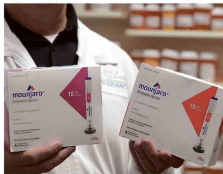
EN DOSIS E INYECTABLE SE PRESENTA TIRZEPATIDA EN CHILE.

“Los estudios nacionales están muy retrasados. Necesitamos actualizar los números para ver la real importancia de la proble-