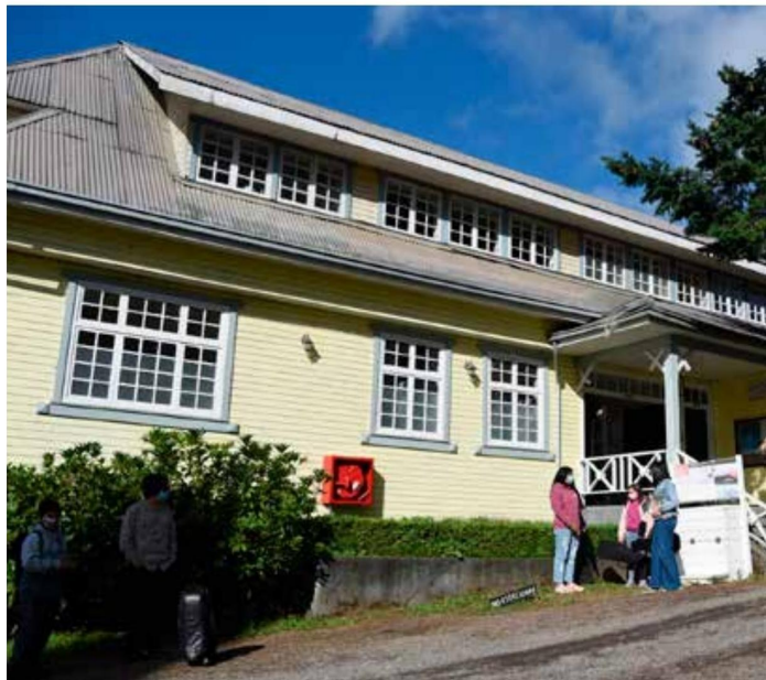
La Casona Cultural de Panguipulli constituye un emillero de artistas y de obras de arte.