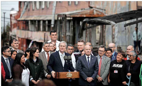
A mediados de marzo, el Presidente José Antonio Kast anunció los ejes del Plan de Reconstrucción Nacional, que incluirá las rebajas de impuestos.

Surge la opción de que en la Operación Renta del año 2027 el recorte en la tasa a las empresas sea de solo medio punto y en 2028 la rebaja pueda ser de una magnitud mayor.