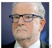
Roberto Zahler, expresidente del Banco Central.

En el encuentro se analizaron las implicancias fiscales de recorte del impuesto corporativo que propondrá el Ejecutivo y cómo golpea las proyecciones macroeconómicas la fuerte alza en los combustibles que anunció hace dos semanas el ministro de Hacienda, Jorge Quiroz.