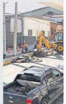
FUE EN CALLE COLÓN.

En menos de cuatro días se produjo una nueva rotura de matriz en Tocopilla