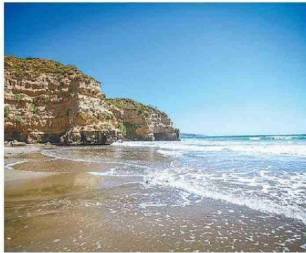
EN LA BASE DEL ACANTILADO DE QUIRILLUCA HAY DOS CAVERNAS.

En el caso particular de la Región de Valparaíso,