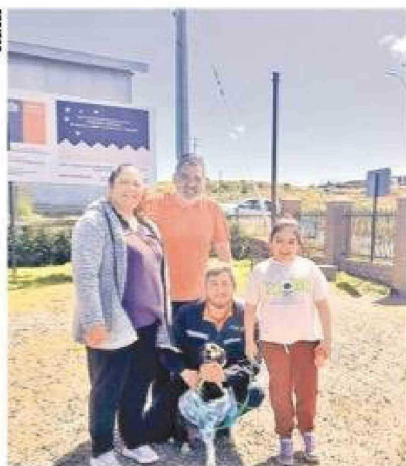
Luna y Freya felices junto a sus nuevas familias.