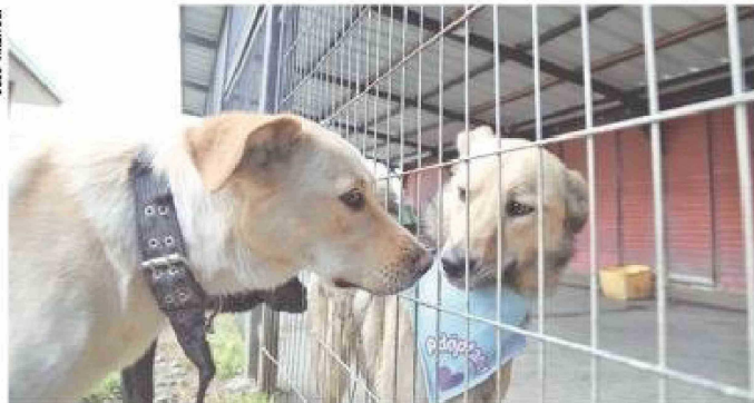
Nala y Jael esperan una oportunidad de adopción en el Centro de Rescate Canino municipal, donde el espacio es limitado y el llamado es a adoptar y no comprar.