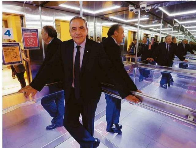
EL SENADOR CUESTIONÓ ESTOS 4 AÑOS DE MINISTROS "SOBERBIOS, COMO MAISA ROJAS O ESTEBAN VALENZUELA".

- ¿Qué nos dice el senador Chahuán esta iniciativa? Le pregunto porque él siempre se ha mostrado como un moderado dentro de la derecha, pero acá aparece impulsando la agenda más dura del Partido Nacional Libertario. - Demuestra su falsedad y una doble careta gigantesca. Por un lado, Chahuán se hace el propalestino y lidera las banderas por los derechos humanos, y en su propio país pretende dejarnos clavada una herida profunda en el alma liberando a los criminales de Punta Peuco. Lo único que quiere es dejar la señal de