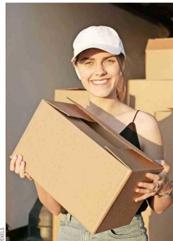
El segmento joven es uno de los que está usando la opción de mini bodegas.

En cuanto a los precios se registra un canon promedio de 0,365 UF/m 2 , influenciado