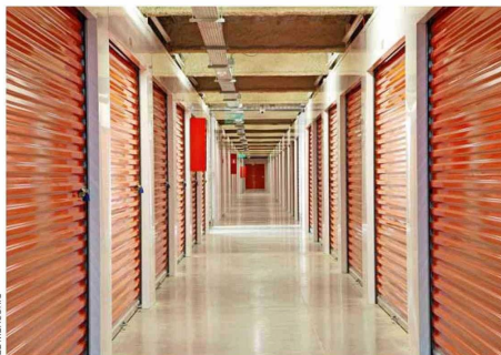
La seguridad y simplicidad para almacenar son parte de los beneficios de las mini bodegas.

"Es un mercado que está creciendo de manera importante debido a que existe una alta demanda por este tipo de espacios. Esto, debido a que las viviendas han tendido a reducir su tamaño, las familias son más pequeñas y los jóvenes han ido posponiendo o descartado la opción de tener hijos. Hoy es común que los jóvenes vivan en departamentos de 30m 2 sin bodega, lo que dificulta destinar espacio para almacenamiento. Además, existe una necesidad creciente de parte de emprendedores que requieren espacio para almacenar