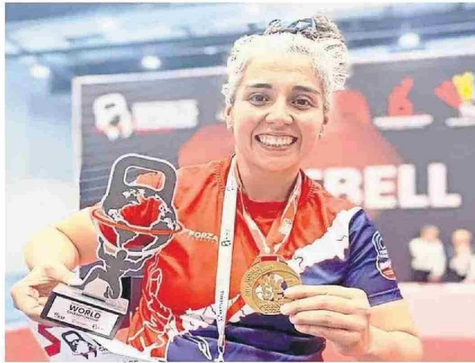
ROCÍO MUÑOZ SE HA TRANSFORMADO EN SINÓNIMO MUNDIAL DEL KETTLEBELL (PESAS RUSAS).