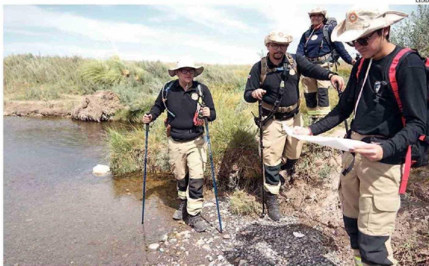
PARA APOYAR LA FORMACIÓN DE LA UNIDAD DE RESCATE AGRESTE DE ALTO EL LOA.

sición de una camioneta equipada con material de rescate y protección personal para los bomberos, fortaleciendo así la capacidad de respuesta en situaciones de emergencia en la región. 🚒