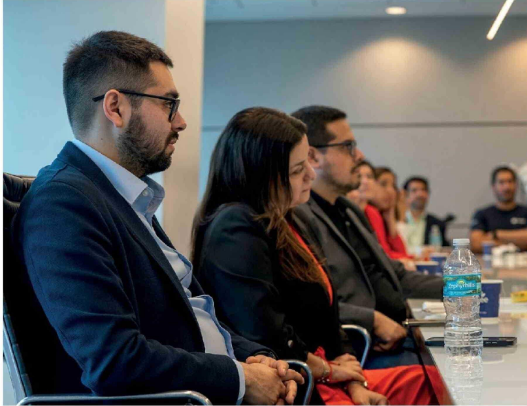
EMPRENDEDORES DEL BIOBÍO y startups tecnológicas son parte del diagnóstico del estudio regional.

la gestión de propiedad intelectual. En paralelo, se necesitan sellos de validación tecnológica, mejores puentes con grandes empresas y más capital inteligente, es decir, inversionistas que aporten no solo recursos, sino también experiencia, redes y capacidad de acompañamiento. Si no cerramos esas brechas, el emprendedor seguirá atrapado entre autofinanciarse, postular a fondos públicos y llegar tarde al mercado.