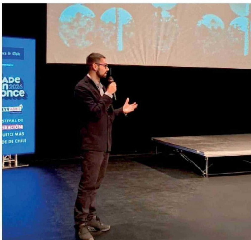
EL ESTUDIO "EMPRENDIMIENTOS que mueven industrias" de Endeavor Biobío analiza el ecosistema emprendedor regional. El informe identifica brechas en financiamiento, escalamiento y articulación en el Biobío.

Primero, hay que asumir que este no es solo un problema de oferta de dinero; es un problema de estructura del ecosistema. El estudio sugiere avanzar en una red más activa de inversionistas ángeles, en vehículos regionales de capital de riesgo y en mecanismos que ayuden a reducir el riesgo percibido. También aparece como crítico fortalecer la asesoría para inversión, el