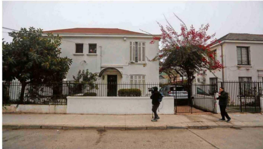
DELITO OCURRIÓ EN LA CASA DEL EXPRESIDENTE DEL TRIBUNAL CONSTITUCIONAL UBICADO EN EL SECTOR EL LLANO, EN SAN MIGUEL.

En esa línea, sumó que "como Renovación Nacional, somos autores del proyecto y lo vamos a defender con toda