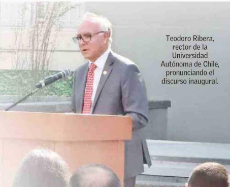
Teodoro Ribera, rector de la Universidad Autónoma de Chile, pronunciando el discurso inaugural.