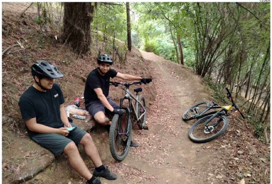
LA IDEA DE LOS VECINOS ES TENER UN PULMÓN VERDE QUE SEA VISITADO POR FAMILIAS Y TURISTAS, QUE YA NO SEA UN LUGAR INSEGURO NI RIESGO-

SECTOR ORIENTE. La iniciativa nació de los propios habitantes de la población Maximiliano Kolbe, que buscan recuperar el cerro que divide los dos sectores y transformarlo con senderos, miradores y áreas para actividades recreativas. Hoy el sitio está lleno de maleza y es usado por hampones para delinquir. Están asesorados por académicos de la Universidad de Concepción.