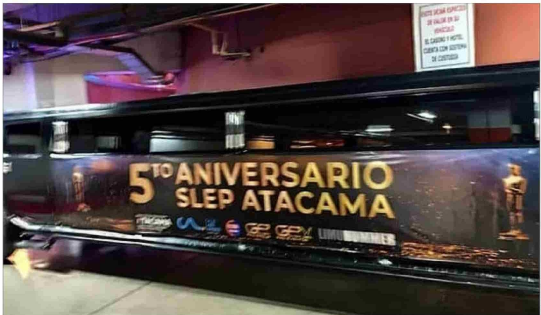
La hummer con cartel de fiesta aniversario fue uno de los puntos más llamativos de la noche.

Esta fiesta sucede en medio de las críticas que ha recibido dicha institución pública que van desde: despidos de trabajadores, reducción de horas docentes, denuncias de un eventual patrón de exclusión de mujeres, además de una administración catalogada