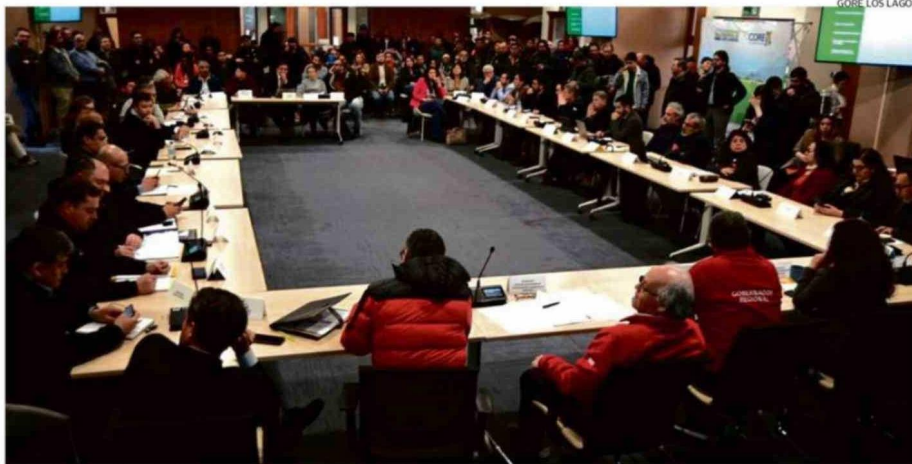
EL CRUBC RECHAZÓ UNA SOLICITUD INDÍGENA SOBRE TERRITORIO DE PUERTO MONTT EN OCTUBRE DEL AÑO PASADO.

“Quienes hemos podido trabajar o dialogar con comunidades indígenas, en diversas otras materias, también con comunidades lafkenches, la experiencia nos enseña el conocimiento de la legislación de que todo proceso debe realizarse a través de las consultas indígenas. No estaré para aprobar ninguna modificación si es que no pasa por consulta indígena reglamentada por el artículo 169 de la OIT”, afirmó. C-3