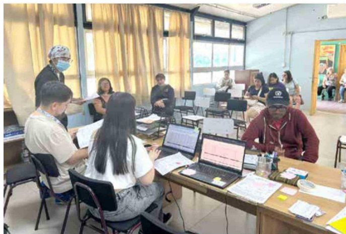
Atenciones gratuitas incluyen tratamientos y prevención.

la Asociación de Voluntarios de Salud (VES), reúne a más de 30 estudiantes y egresados que trabajan bajo un modelo de odontología social basado en la autogestión y donaciones. El despliegue se concentra en las dependencias del Liceo de Teno, donde el equipo habilitó boxes odontológicos para otorgar "altas integrales", garantizando que cada paciente complete su tratamiento antes de finalizar la jornada. Las prestaciones incluyen limpiezas, restauraciones, reparación de prótesis y orientación preventiva, junto con la entrega de kits de higiene dental. Gran parte de la logística del operativo es financiada por los propios voluntarios a través de actividades autogestionadas, mientras