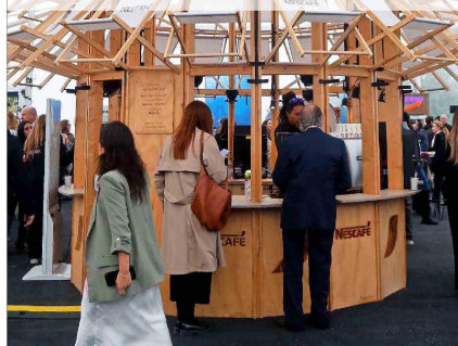
Junto al espacio principal, el evento también cuenta también con un sector de stands.