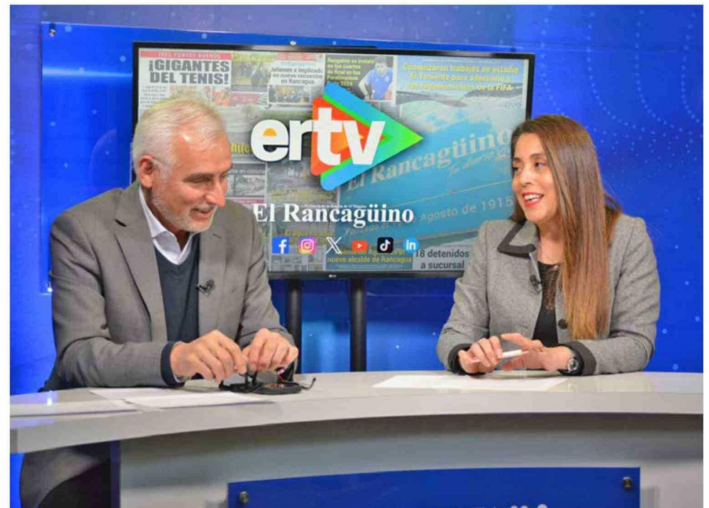
Seguridad pública y fortalecimiento comunitario marcaron parte de la conversación con el Gobernador Pablo Silva, donde el gobernador explicó el impacto de los proyectos del 8% en barrios de la región.

CON FOCO EN SEGURIDAD PÚBLICA, CONECTIVIDAD, SALUD E INVERSIÓN SOCIAL, EL GOBERNADOR REGIONAL DE O'HIGGINS, PABLO SILVA AMAYA, REPASÓ LOS PRINCIPALES PROYECTOS QUE HOY IMPULSA EL GOBIERNO REGIONAL: CASI 400 INICIATIVAS DEL 8% DE SEGURIDAD, LUMINARIAS EN PICHILEMU, PÓRTICOS CON TELEVIGILANCIA, NUEVAS ESTACIONES DE TRENES, APOYO A TELETÓN Y UNA HISTÓRICA INVERSIÓN EN BOMBEROS.