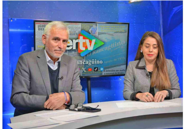
Durante la entrevista, la autoridad regional detalló avances en proyectos emblemáticos como pórticos de televigilancia, luminarias, estaciones ferroviarias y apoyo a Teletón O'Higgins.

Silva recordó que la experiencia de los incendios forestales de 2017 marcó un punto de inflexión "Ahí vimos las condiciones en que estaban los bomberos