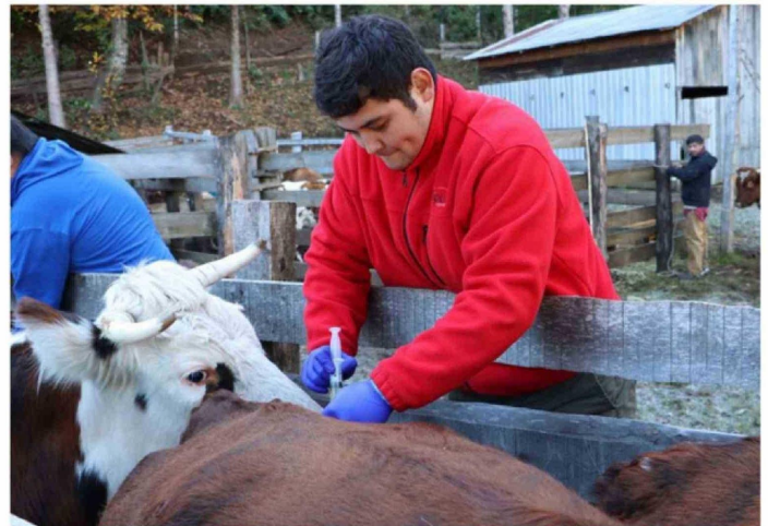
LA JORNADA PERMITIÓ ENTREGAR ATENCIÓN PREVENTIVA A DIVERSOS ANIMALES, ENTRE ELLOS, EQUINOS, BOVINOS, OVINOS Y TAMBIÉN ANIMALES MENORES.