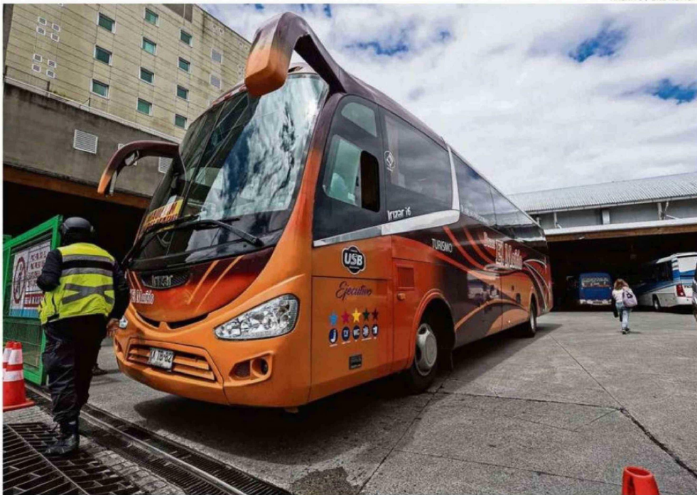
LOS BUSES DE TURISMO REPRESENTAN EL VALOR MÁS ALTO POR EL DERECHO A LOSA, CONFORME AL TARIFARIO DEFINIDO POR LA MUNICIPALIDAD.