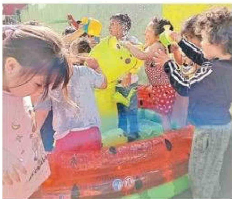
Parte de las actividades desarrolladas en el programa Vacaciones en mi jardín.