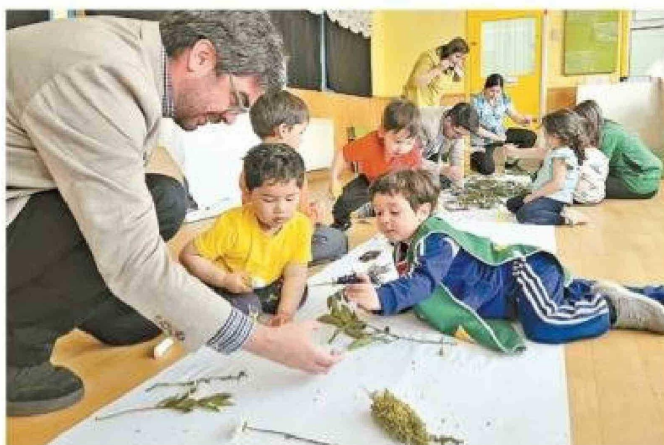
Niños que participan en el programa Vacaciones en mi jardín se convirtieron en "exploradores de la naturaleza".