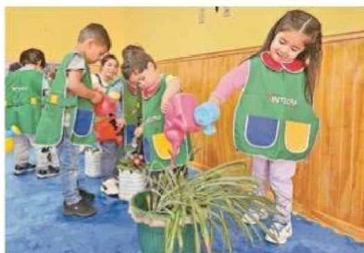
Durante todo el verano el jardín infantil Keola Kipa ha sido escenario de juegos, música y aprendizajes.

hojas de árboles, además de una exposición de imágenes de fauna regional. Este escenario estimuló los sentidos de las niñas y niños, invitándolos a tocar, oler, observar y descubrir el entorno, comprendiendo que cada elemento de la naturaleza tiene un valor propio y un papel dentro del ecosistema.