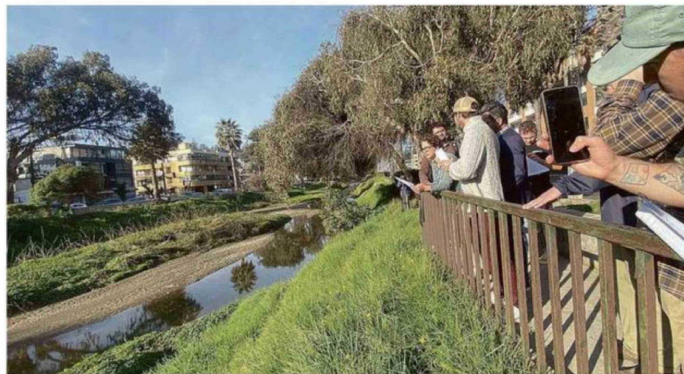
CONTAMINACIÓN, DRENAJE Y CAMBIO USO DE SUELO: PROBLEMAS.

El Ministerio del Medio Ambiente está trabajando en la protección de 48 ecosistemas en Petorca, Quillota, Marga Marga, Valparaíso y San Antonio".