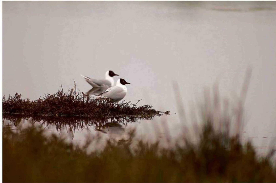
EN ALIANZA CON ONU MEDIO AMBIENTE, PROYECTO GEF HUMEDALES COSTEROS: GESTIONA RECURSOS EN PROTECCIÓN Y GOBERNANZA.

Pero, ¿qué significa su nombramiento como Humedal? Apunta a Ley 21202, "cuenta con que se protejan estos entornos una vez declarados, evitando su degradación". Lo más valorable de la normativa a su juicio: "Gestión y monitoreo del humedal, que puede ser liderada por el municipio con otros organismos: universidades,