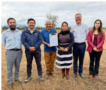
LA RESOLUCIÓN SANITARIA OBTENIDA, RESPONDE A UNA SENTIDA DEMANDA DE DIVERSAS COMUNIDADES INDÍGENAS DE LA REGIÓN.

El logro cobra especial relevancia considerando la historia del lugar. El cementerio había sido clausurado en 1974, durante la dictadura, obligando incluso a