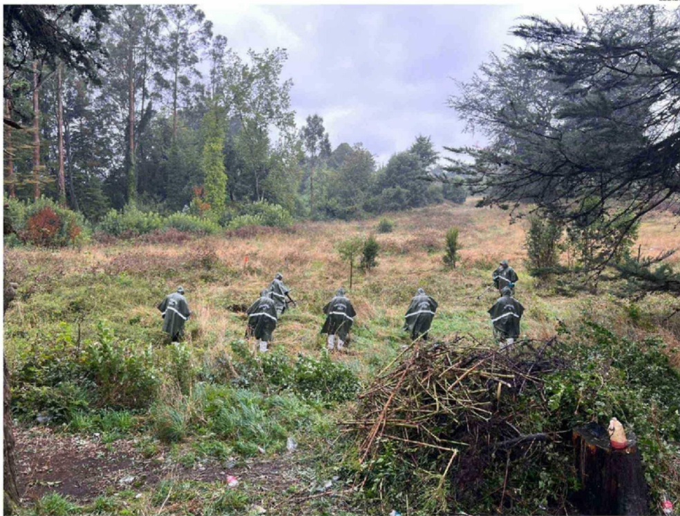
VARIOS OPERATIVOS Y RASTREOS CUMPLIÓ PERSONAL ESPECIALIZADO DEL LABOCAR DE CARABINEROS EN LA ZONA DONDE OCURRIÓ EL ATAQUE.

de servicio llevaba el suboficial en Carabineros, y en la Primera Comisaría de Puerto Varas.