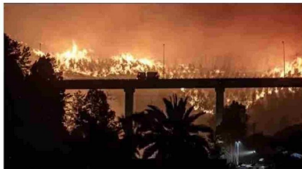
EN MÁS DE MIL SE ESTIMAN LAS VIVIENDAS DESTRUIDAS. — Un total de 19 muertos dejaban los incendios, que seguían activos en las regiones de Nuble y Biobío, mientras otras zonas del país también sufren este tipo de siniestros. La imagen corresponde a Penco.

“Hemos aprendido muy poco en la prevención de desastres y en la capacidad de enfrentar los vectores que originan los incendios. Hay una desplanificación regional”.