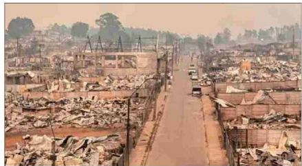
“TORMENTAS DE FUEGO.” — Este nuevo tipo de siniestros, con rápido avance a las ciudades, será cada vez más frecuente en el marco del cambio climático, dicen los expertos. En la imagen, Punta de Parra (comuna de Tomé, provincia de Concepción).