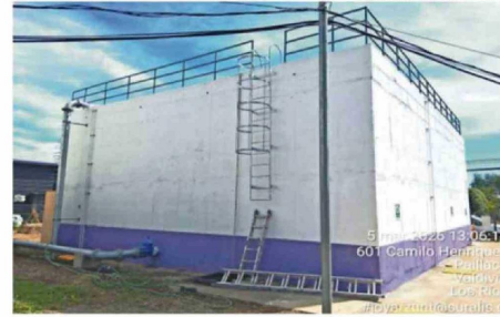
ESTE ES UNO DE LOS ESTANQUES DE AGUA POTABLE DE PAILLACO.

Por eso, para nosotros ha sido clave mantener una coordinación permanente con el sector público y privado. En la Región de Los Ríos, por ejemplo, hemos trabajado con el Gobierno Regional y también en mesas con Mívu y Serviu lo que ha sido clave para acelerar el desarrollo de viviendas sociales, y también hemos mantenido instancias de coordinación con actores del sector privado. El desarrollo urbano necesita