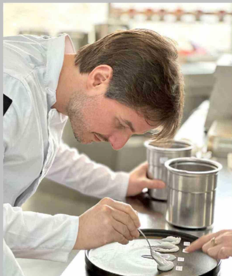
Los chefs de Fundación Alicia experimentan con distintos alimentos, ingredientes y técnicas culinarias saludables.