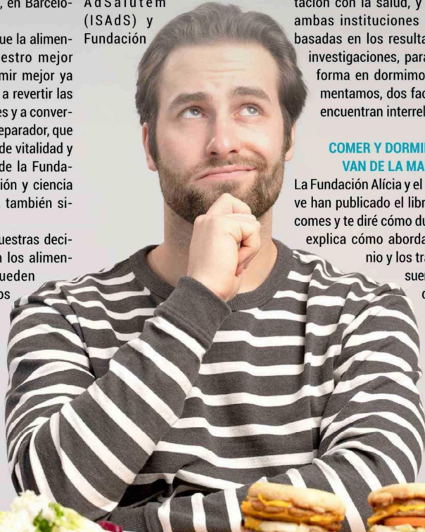
Nuestras elecciones y hábitos alimentarios influyen significativamente en nuestra salud y en nuestro sueño.

Nuestras costumbres y decisiones alimentarias pueden ser grandes aliados para solucionar el insomnio y otros trastornos del sueño, según el Instituto AdSalutem y la Fundación Alicia.