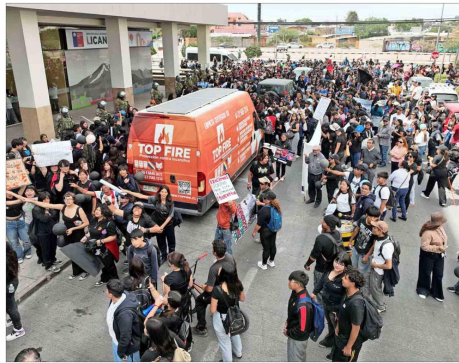
MOVILIZACIÓN.— Estudiantes, apoderados y docentes de Calama marcharon ayer hasta el SLEP Licancabur para exigir mayor seguridad y la salida de la directiva del Instituto Obispo Silva Lezeta.

escolar. En las últimas semanas, irrupciones en liceos emblemáticos han incluido el uso de bombas molotov, tensionando aún más el ambiente en los colegios. En octubre de 2025, en las páginas de este diario, distintos actores sociales adelantaban que si había un gobierno de signo político distinto, era probable que hubiera más manifestaciones. De hecho, se indicó que, por ejemplo, el pasaje del transporte