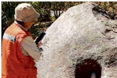
HALLAZGOS SE UBICAN EN SECTOR ALTO DE SAN JUAN.