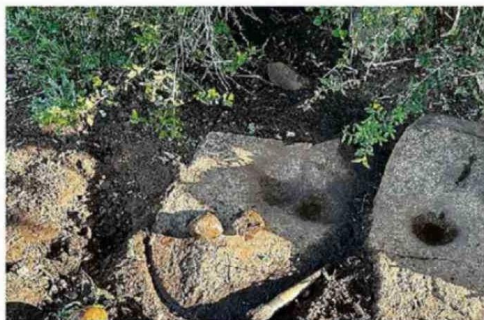
TACITAS EVIDENCIAN OCUPACIÓN HUMANA DE CIENTOS DE AÑOS.

existen evidencias del Período Alfarero Temprano, entre los años 300 antes de cristo y 900 después de cristo, etapa en que grupos humanos desarrollaron actividades de caza, recolección y horticultura, junto con la producción de cerámica y asentamientos estables.