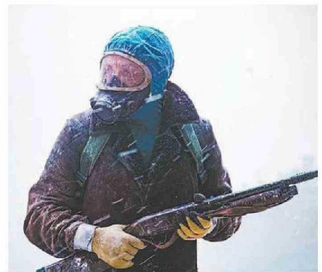
"EL ETERNAUTA" SE BASA EN LEGENDARIA HISTORIETA DE CIENCIA FICCIÓN ARGENTINA, QUE MUESTRA UNA INVASIÓN EXTRATERRESTRE EN BUENOS AIRES.

Congonhas. Tragedia anunciada: narra la historia de la tragedia aérea con más muertes de toda Latinoamérica en un vuelo de TAM. Estreno el miércoles 23 en Netflix. ✨