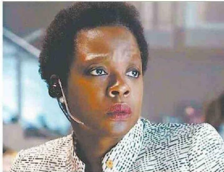
LA GANADORA DEL OSCAR VIOLA DAVIS INTERPRETA A LA PRESIDENTA DE EEUU. EN LA CINTA DE ACCIÓN "G20".

Government cheese: surrealista comedia familiar ambientada en 1969 en el Valle de San Fernando (California) que cuenta la historia de los Chambers, un peculiar clan que persigue sueños muy grandes y aparentemente imposibles, liberados de las restricciones del pensamiento realista. Sin embargo, cuando el patriarca, Hampton Chambers (David Oyelowo) sale de la cárcel, la armonía familiar entra en crisis. En Apple TV+ desde el miércoles 16.