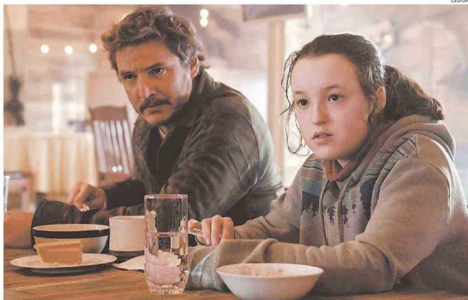
LA SEGUNDA TEMPORADA DE "THE LAST OF US" RETOMA LOS PERSONAJES DE PEDRO PASCAL Y BELLA RAMSEY 5 AÑOS DESPUÉS DE LOS SUCESOS DEL PRIMER CICLO.

Karma: miniserie surcoreana en la que un fatídico accidente entrelaza las vidas de seis personas en esta historia de karma y