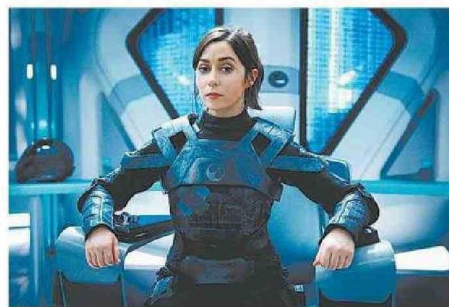
LOS JUEGOS, LAS SIMULACIONES NEURONALES Y LAS REALIDADES VIRTUALES PROTAGONIZAN EL SÉPTIMO CICLO DE "BLACK MIRROR".

Black mirror 7: la serie antológica británica, que muestra el lado oscuro de