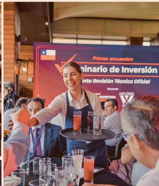
Un espacio de Networking acompañado de cóctel y cata de Whisky para los inversionistas y concesionarios.