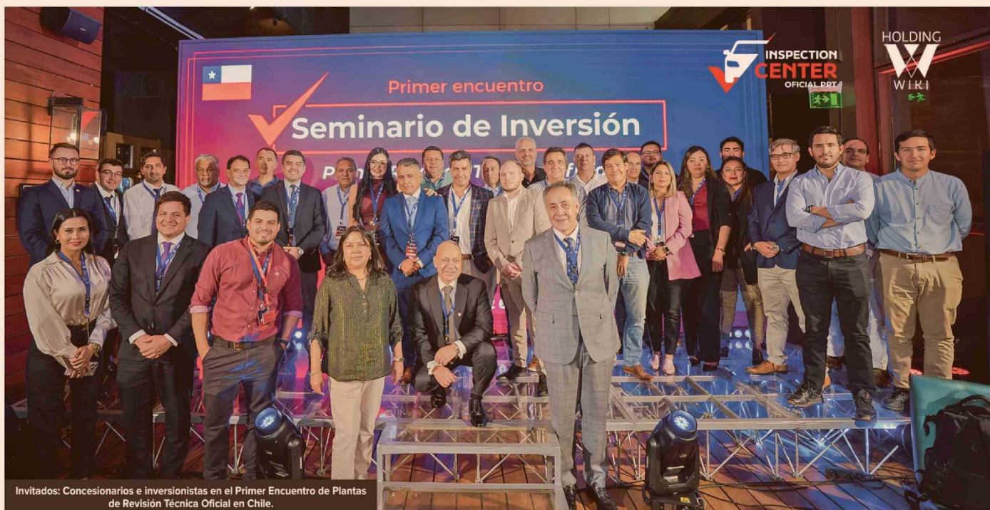
Invitados: Concesionarios e inversionistas en el Primer Encuentro de Plantas de Revisión Técnica Oficial en Chile.