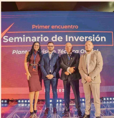
Expositores y Anfitriona en el primer encuentro PRT 2026.