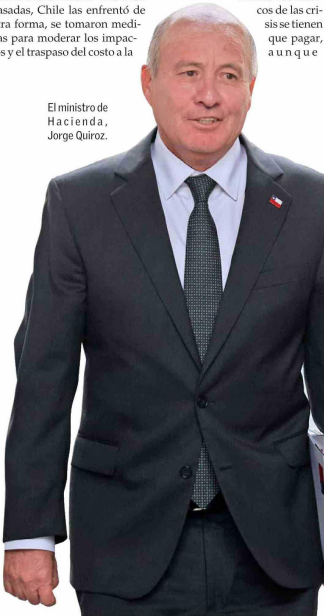
El ministro de Hacienda, Jorge Quiroga.