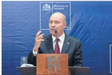
QUIROZ SUMÓ MEDIDAS A LAS ANUNCIADAS POR KAST.

discusión menos que vamos a tener en el Congreso".