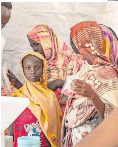
LA ORGANIZACIÓN MSF YA SUPERA LOS MIL SOCIOS EN CHILE.

"El reclamo ciudadano es el motor de nuestra labor: al denunciar, el consumidor no solo busca una solución individual, sino que entrega la evidencia necesaria para corregir malas prácticas en beneficio de toda la comunidad", concluyó el jefe regional del Sernac.