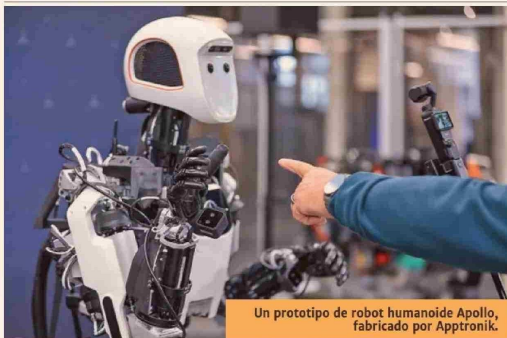
Un prototipo de robot humanoide Apollo, fabricado por Apptronik.

Título: Las tecnologías de defensa se toman el capital de riesgo para startups en Silicon Valley