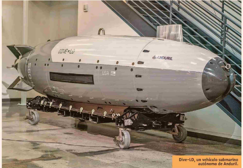
Dive-LD, un vehículo submarino autónomo de Anduril.

■ La inversión global en defense tech cerró 2025 con un récord histórico de US$ 49.900 millones, casi el doble de los US$ 27.300 millones del año anterior, según datos de PitchBook.