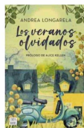
LOS VERANOS OLVIDADOS Andrea Longarela Booket 384 páginas / $10.430