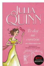
TE DOY MI CORAZÓN Julia Quinn Titania 352 páginas / $17.010