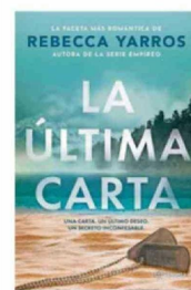
LA ÚLTIMA CARTA Rebecca Yarros Planeta 528 páginas / $17.430

La segunda es "Te doy mi corazón", de Julia Quinn, que ha vuelto a posicionarse entre los favoritos debido a la nueva temporada de la serie "Bridgerton" de Netflix. El libro cuenta la historia de Sophie y Benedict Bridgerton, marcada por secretos, diferencias sociales y segundas oportunidades.