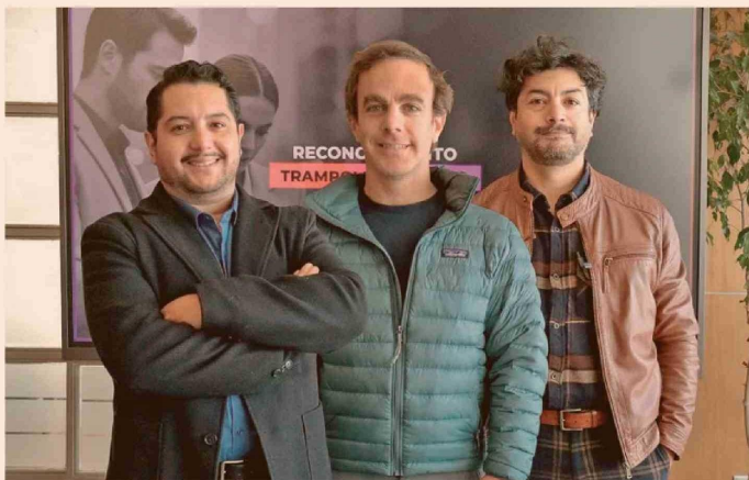
Ganadores Reconocimiento Trampolín Lab 2025-2026

La experiencia de la Coordinación de Transferencia Tecnológica de la UFRO demuestra que el desafío no es sólo gestionar tecnologías, sino también canalizar la investigación mediante vías de transferencia tecnológica adecuadas, favoreciendo su proyección desde La Araucanía.