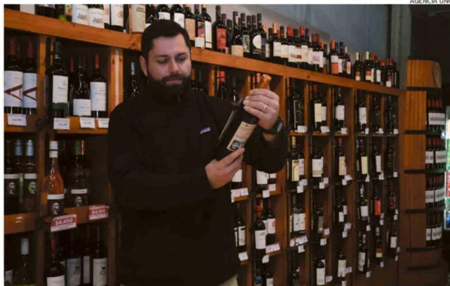
LA VARIEDAD DE VINOS ES UNA DE LAS MÁS AMPLIAS DE LA CIUDAD, UN SELLO DEL NEGOCIO FAMILIAR.

-Exactamente. Nosotros tratamos de ofrecer productos locales que puedan competir de igual a igual con productos elaborados por grandes compañías. Les damos un espacio y, en algunos casos, también entregamos asesoría a estos productores locales, ya sea con la conformación de sus sociedades, ideas y prediseño de logos. A algunos los asesoramos para que obtengan resoluciones sanitarias y también les enseñamos a instalar códigos de barras, para que puedan no solamente venderlos a nosotros, sino que también a otros negocios y puedan ingresar al retail. Nuestra idea es que les vaya bien y que puedan utilizar a Yogui Market como una plataforma de impulso, de progreso, donde nosotros podamos apalancarlos y ellos continúen creciendo.