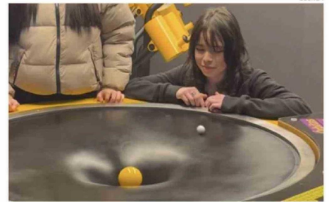
12 MÓDULOS INTERACTIVOS CONTEMPLA LA MUESTRA.

La fuente destacó que "esta es una de nuestras muestras itinerantes, eso