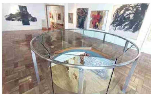
Entre sus pisos, la NUGA ofrece gran variedad de técnicas en sus obras.

pretación de su entorno con el fin de recrear el paisaje de la ensueñación y su propia configuración de la realidad. La visita para este compilado internacional estará disponible para los interesados hasta el día viernes 30 de enero y