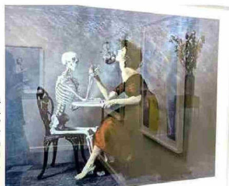
Obra fotográfica el autor belga Harry Fayt de la colección "Sueños".