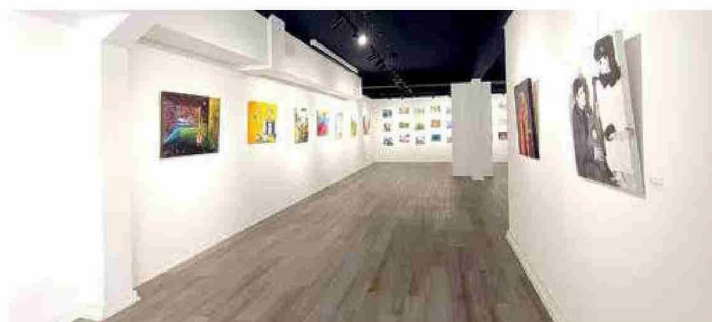
La Casa del Arte expone las obras de los estudiantes de los talleres de pintura.