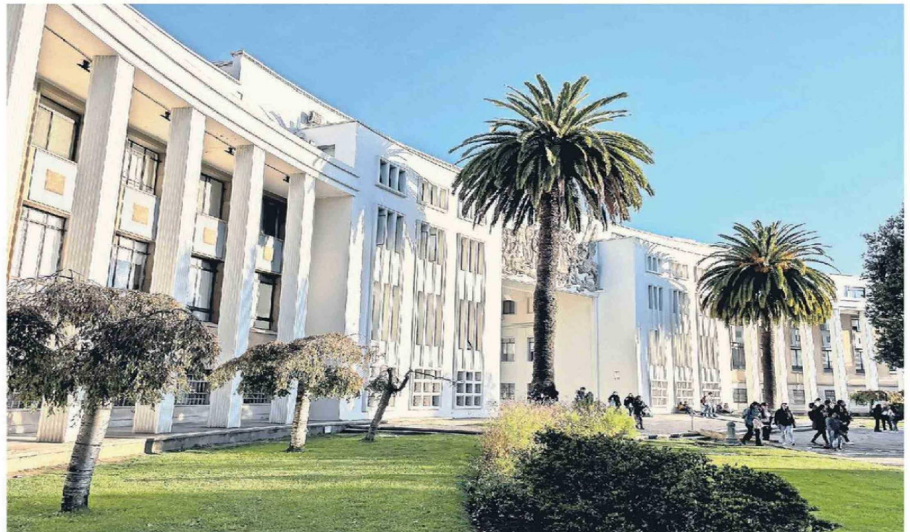
El Arco de la Universidad de Concepción podrá ser recorrido este sábado 30 y domingo 31 de mayo desde las 10 horas. Para inscribirse en los tours guiados hay que revisar patrimonio.udec.cl/dia-patrimonio .

El edificio, diseñado por la arquitecta Gabriela González De Groote junto a Edmund Buddenberg Martínez y construido entre 1946 y 1951, ya para su época rompía esquemas con grandes ventanales que invitaban a inundar los espacios de luz y naturaleza vida desde sus entornos. La obra, con su destacada columnata perimetral y detalles más bien clásicos en el moderno contexto arquitectónico de esa época es, como señala el Vicerrector de la VRIM Udec, "escollida por la Casa del Arte, cuya Pinacoteca contiene una de las colecciones de pintura chilena más importantes del país, y el