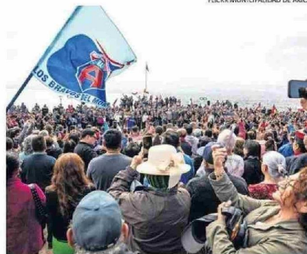
UN HIMNO QUE SE CANTÓ POR IGUAL CON EL NACIONAL.

El himno fue interpretado por la banda instrumental de la Guarnición Militar y el Orfeón Municipal, marcando un hito ciudadano que conectó generaciones en un acto que tuvo gran impacto.