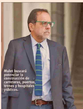
Mulet buscará potenciar la construcción de carreteras, puertos, trenes y hospitales públicos.

Su candidatura busca fortalecer el rol estratégico del Estado en sectores clave como el cobre, el litio y energía, impulsando la empresa nacional del litio y una transición ecológica “justa”.