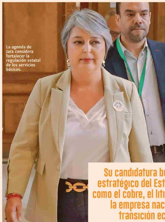
La agenda de Jara considera fortalecer la regulación estatal de los servicios básicos.

La exsecretaria de Estado, en el plano económico, quiere avanzar