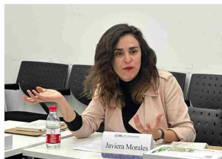
LA PARLAMENTARIA MAGALLÁNICA, EXPRESÓ QUE ESPERA QUE LA REGIÓN CUENTE CON UN FERIADO REGIONAL.

"Tenemos un problema con la inseguridad en todo el país, sin embargo, en la región, los índices aún indican que somos los que tenemos calles más seguras. Por eso a mí me preocupan de sobremanera las tasas de delitos al interior de los hogares. Nuestros números de delitos