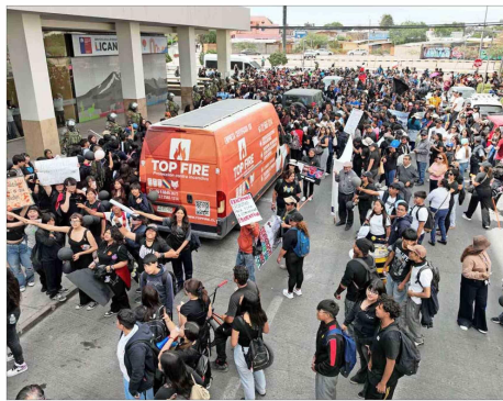
MOVILIZACIÓN.— Estudiantes, apoderados y docentes de Calama marcharon ayer hasta el SLEP Licancabur para exigir mayor seguridad y la salida de la directiva del Instituto Obispo Silva Lezeta.

"en un nivel de alerta más alto que el tradicional, dado lo que ocurrió en Calama, porque las comunidades escolares están todas obviamente más afectadas". La ministra de Educación, María Paz Arzola, indicó que "estamos trabajando en medidas para poder atender los problemas de seguridad que se dan en el espacio escolar, pero también los problemas de fondo que tienen naturalmente relación con esto".