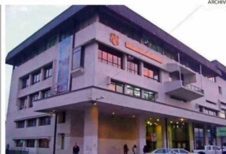
COSTOS DE LAS MEDIDAS SERÁN ASUMIDOS POR EL MUNICIPIO.